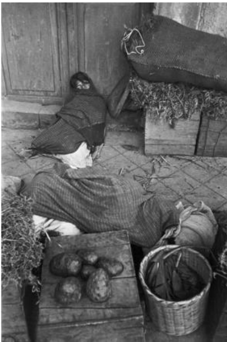
Uruapan, Mexique, 1934-1935