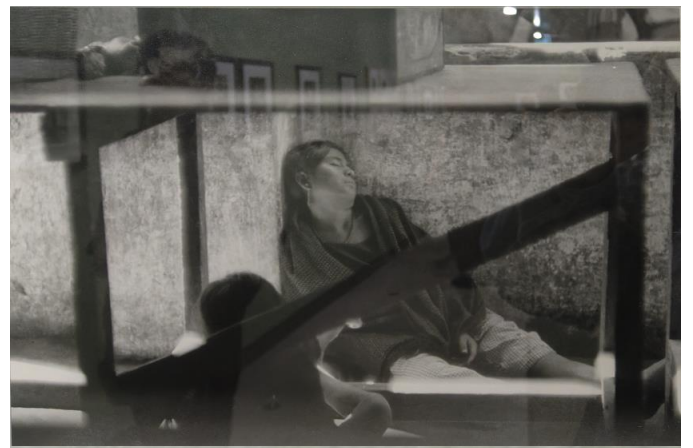
Juchitán, Mexique, 1934-1935