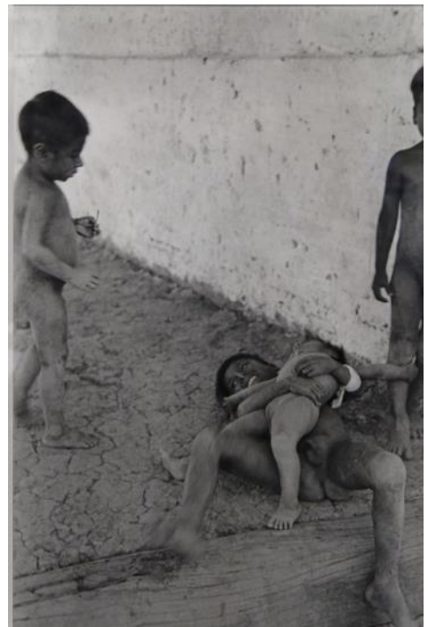
Juchitán, Mexique, 1934-1935