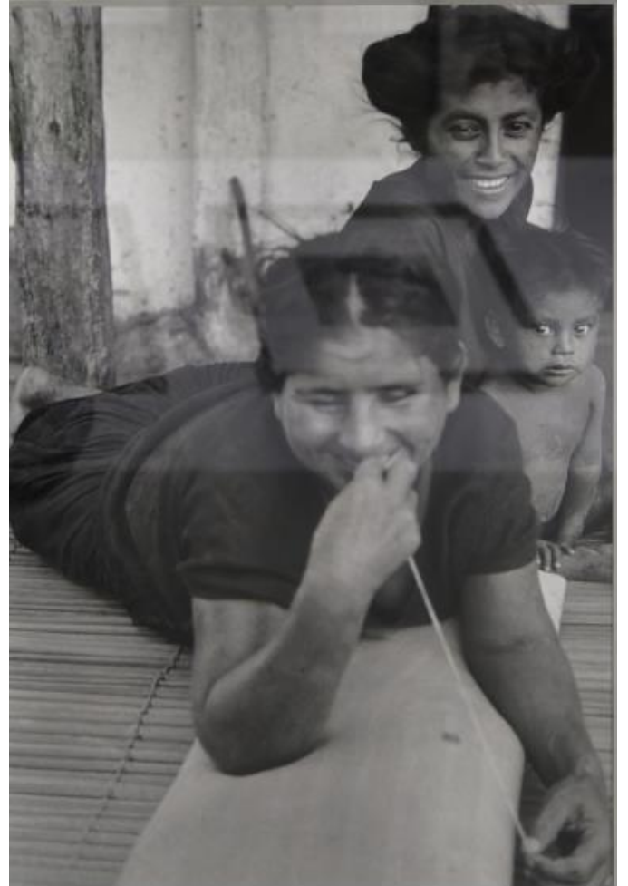
Henri Cartier-Bresson, Juchitán, Mexique, 1934-1935