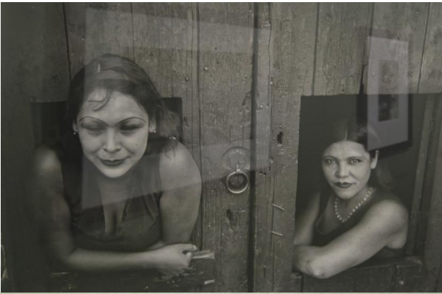
Prostituées, Calle Cuauhtemotzin, Mexico, 1934-1935